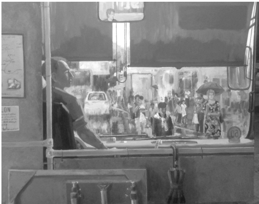
U.Sh.Ismatov- “Deraza ortidagi hayot” 2016 y. 110x145 m.m.

Maishiy turmushning dastgohli rangtasvirda ifodalanishi rassomni beixtiyor o‘ziga jalb etadi. Kartinada yaratiladigan kompozitsiya tomoshabinni chuqur o‘yga solishi bilan birga uni tasvirdagi xayotga olib kiradi. Inson tasviriy xayotni kuzatish mobaynida unda aks etgan ranglar bilan yashaydi, his qiladi. Rangtasvirda ranglar va hissiyotlar eng oliy darajadagi omil hisoblanadi. Uning har bir ijodkorda turli tarzda o‘z ifodasini topishi chek-chegarasiz ekanligining yorqin isbotidir.